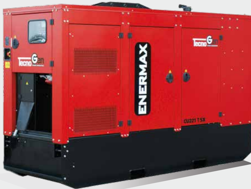
◀ CU 221 T SX